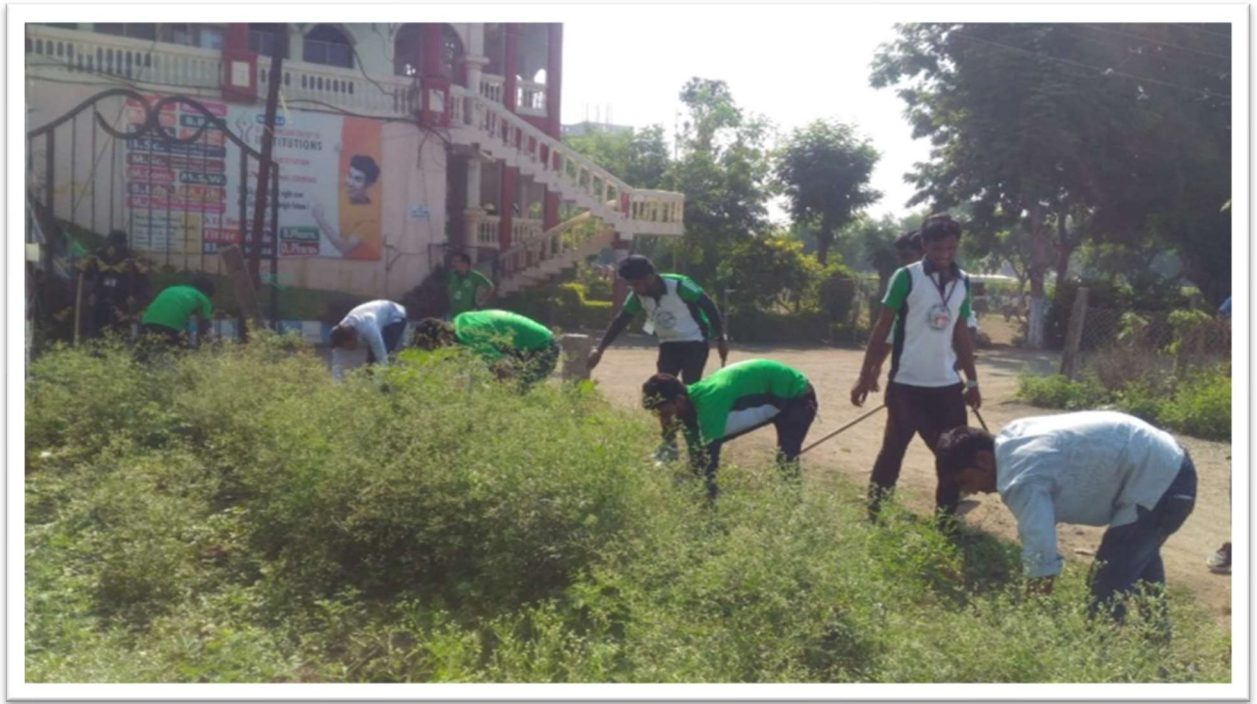
Cleanliness Drive at Campus