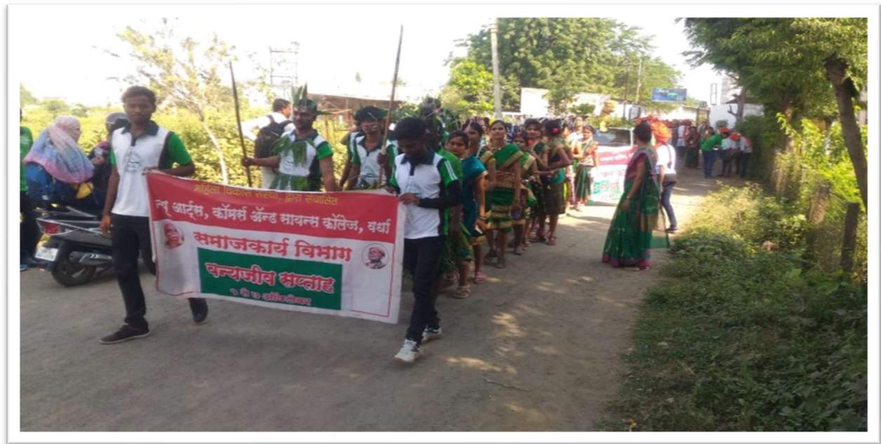
Wildlife Conservation and Protection Rally