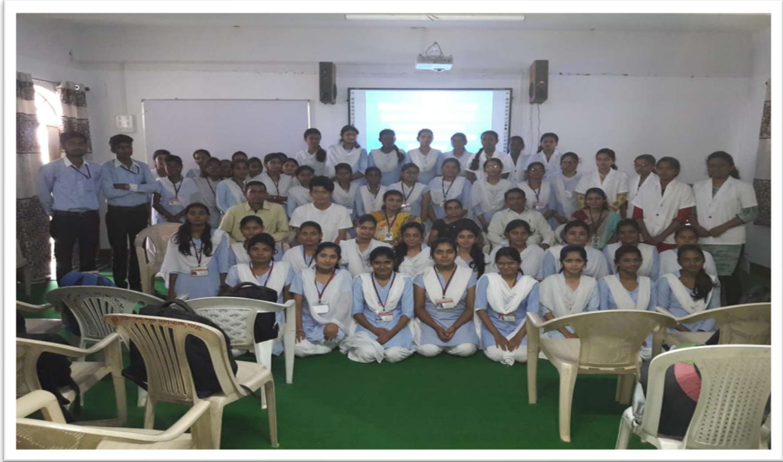
Water and Energy Conservation oath