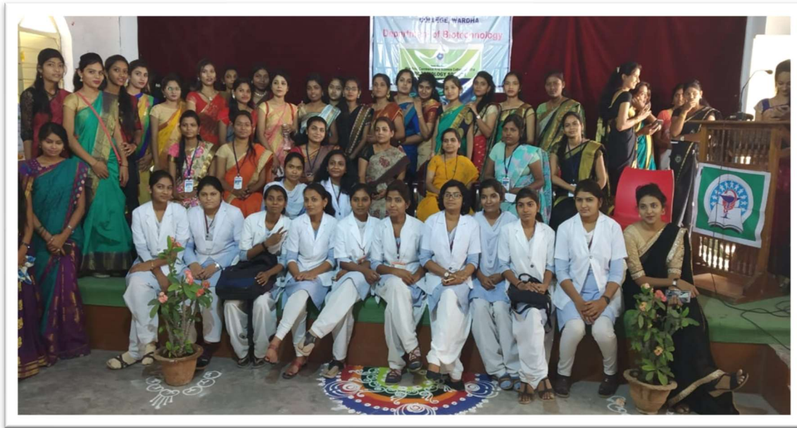
World Environment Day Celebration