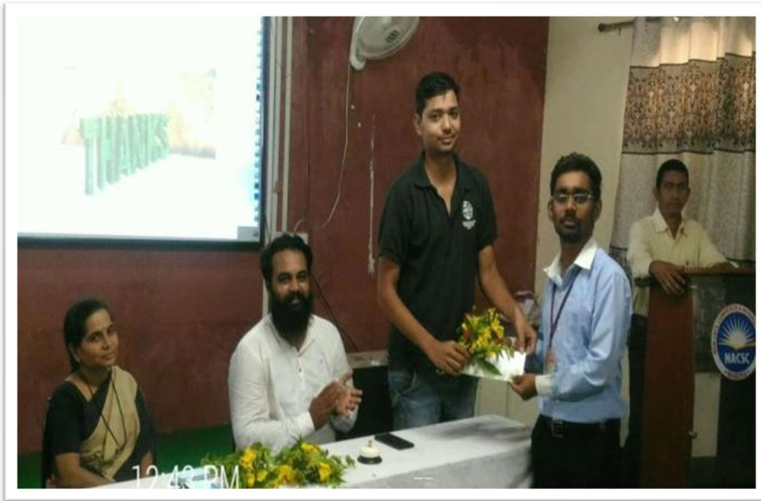
Global Tiger's Day Celebration